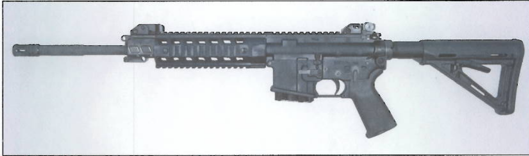
Abb. 1: SIG 516 Sport, Kal. .223 Rem. Ansicht linke Seite