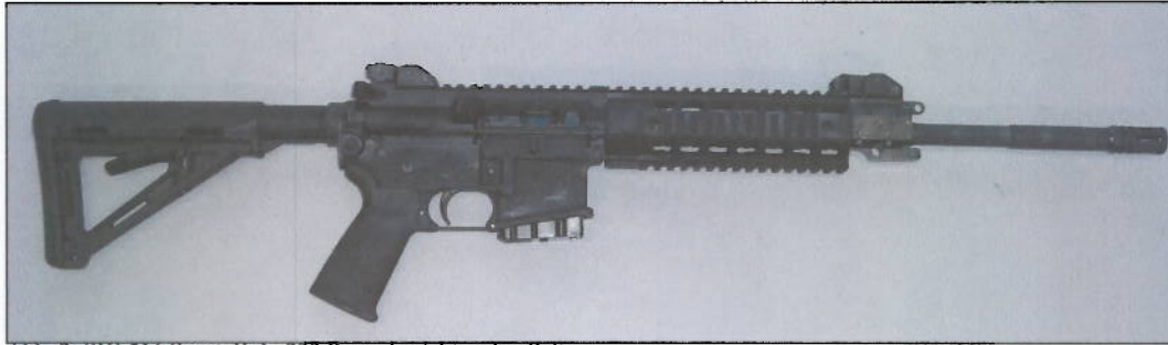
Abb. 2: SIG 516 Sport, Kal. .223 Rem. Ansicht rechte Seite

Die Firma SIG SAUER GmbH & Co. KG, Eckernförde beabsichtigt, das o. a. Selbstladege- wehr „SIG 516 Sport“ als komplette Waffe, sowie jeweils Lauf und Gehäuseoberteil als Wechselsystem